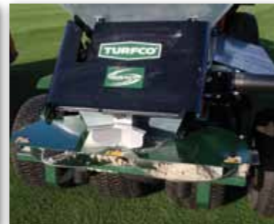
Wide Spin™ technologie umožňuje nastavení diskového rozmetacího ústrojí pod libovolným úhlem (0±15° u CR10 a 0±18° u CR7)