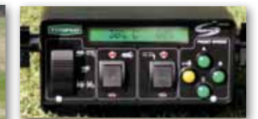
Elektronické programovatelné ovládání