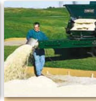
Příčný dopravník otočený o 180° usnadňuje distribuci materiálu (CR-7, CR-10)