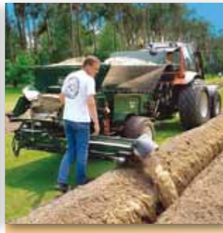
Možnost uzamčení příčného dopravníku v jakékoliv pozici (CR-7, CR-10)