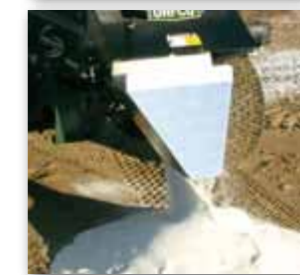
Zařízení na plnění rýh a příkopů (WS1530, WS1540)