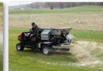
Pro lepší penetraci písku do trávníku lze nastavit diskové rozmetací ústrojí v rozmezí od 0° do -12°.