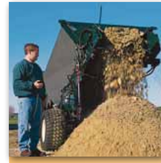
Objemná galvanizovaná násypka 3,1 m 3 se vyloží za méně než 30 sekund (CR10)