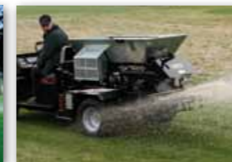
Pro ultra lehké pískování umožňuje WideSpin nastavení diskového rozmetacího ústrojí v rozmezí od 0° do +14°.