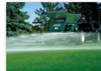
Pravidelný lehký top-dressing 18-ti jamkového hřiště zabere 90 min

Verze 1540 kombinuje technologii WideSpin1530 s elektronickým programovatelným ovládáním pro snadné a rychlé naprogramování. Navíc umožňuje předvolit programy pro zopakování prověřeného nastavení pískování (kombinace rychlosti a nastavení diskového ústrojí). WS1540 je v dostání v tažené verzi a jako nástavba na pracovní vozík typu Cushman, kde je ovládací jednotka možná integrovat do palubní desky.