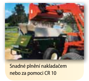
Snadné plnění nakladačem nebo za pomoci CR 10