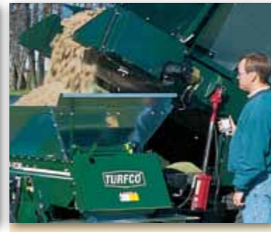
Snadné a efektivní nakládání menších typů kartáčových i diskových pískovačů