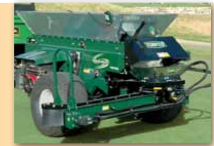
▲ Příčný dopravník (WS1530, WS1540)