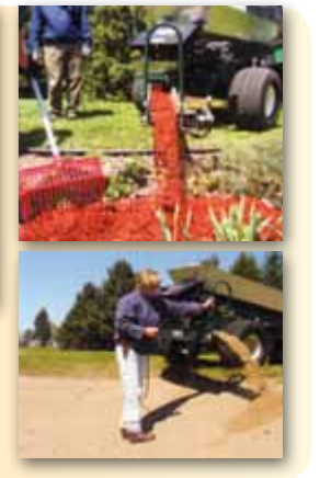
Plnění rýh, bunkerů, záhonů, atd. za pomoci příčného dopravníku